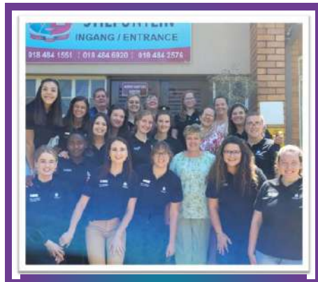
Educational Psychology Lectures and Students with Laerskool Stilfontein Staff