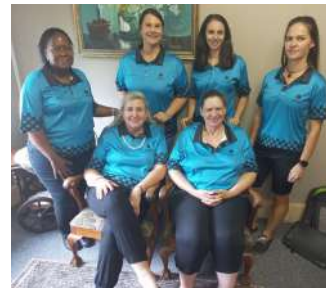
Staff on Vanderbijlpark Campus