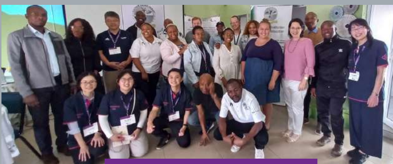
A group photo at Platinum Village Primary in Rustenburg