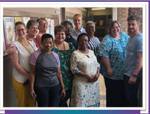
Educational Psychology Lectures with Potchefstroom Hospital and NG Welfare Staff

Ná hierdie blootstelling aan samewerking is die BEd Honneurs in Opvoedkundige Sielkunde-studente toegerus om na hulle eie gemeenskappe terug te keer en gemeenskapswelstand te bevorder deur onafhanklik as geregistreerde ASCHP-beraders te funksioneer - ’n broodnodige fokus in die Suid-Afrikaanse konteks.